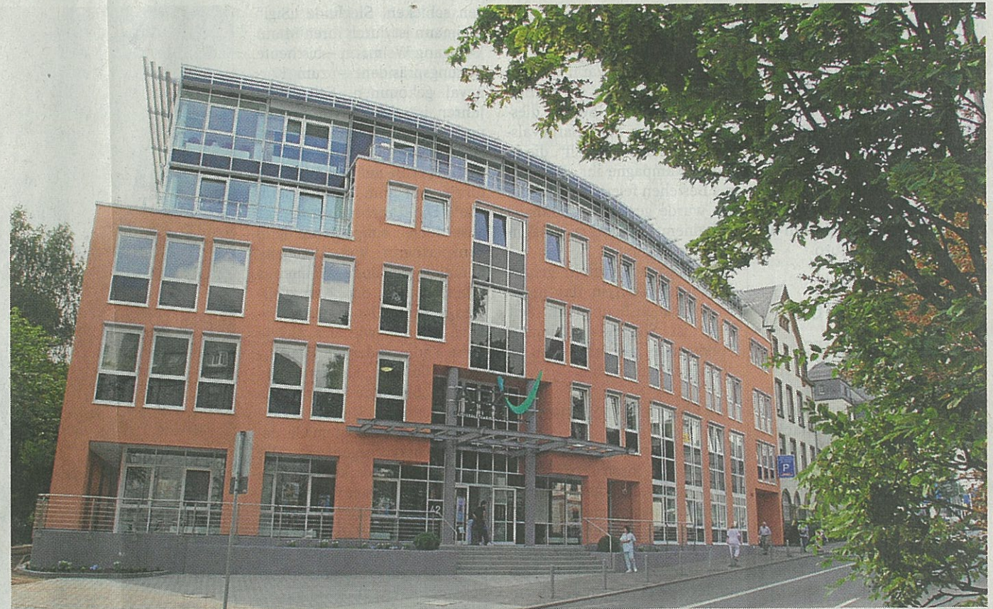
Müssen Ärzte enger zusammenrücken? Im Bild das Asklepios-Gesundheitszentrum, eines der Zentren in Wiesbaden.

nen Traum von der beispielgebenden hessischen Landeshauptstadt. Mit Hinweis auf neue gesetzliche Richtlinien, laut der ab 2011 jede Stadt ein Konzept zur „transsektoral integrierten Versorgung“ erstellen muss, forderte der Referent, „genossenschaftliche Gedankengüter des Mittelstands im Gesundheitswesen neu zu ordnen.“ Die niedergelassenen Ärzte hätten sich viel zu lang auf einen egozentrischen Tunnelblick und das Beklagen ihrer Situation beschränkt, statt im Interesse des Patienten mit anderen Berufsgruppen zusammenzuarbeiten. „Dieses Aneinander-Vorbei ist für mich das Schrecklichste in der Entwicklung des Gesund-